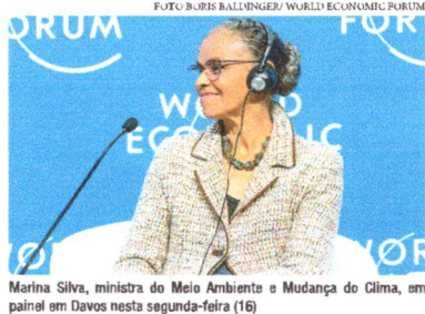
Marina Silva, ministra do Meio Ambiente e Mudança do Clima, em painel em Davos nesta segunda-feira (16)

Ministra Marina Silva foi aplaudida no Fórum Aberto de Davos ao declarar que o governo Lula está comprometido com o desmatamento zero